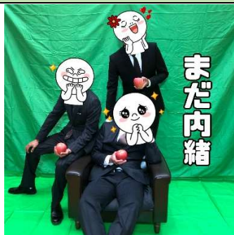
普段は作業着のアノ人が…夜の香りに変身！？

秋の本格りんごシーズンに向けて準備している、「東目屋男子」=「メヤダン」パンフレットの作成。青年部の皆さんに無理を承知でお願いした、「イケメン写真、撮らせてちょうだい！！」普段は作業着の皆さんも、この日はスーツでビシッとキメて撮影しました。